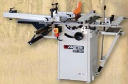
OP 201 Circular saw Tischkreissäge OP 201 Циркулярная пила OP 201