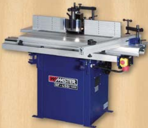
SF 450 Spindel Moulder Tischfräse SF 450 Нижний фрезерный станок SF 450