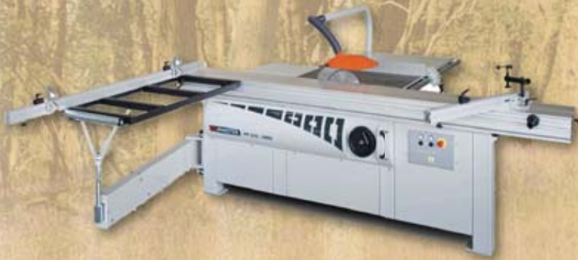
FP 315 Panel sizing saw Formatkreissäge FP 315 Обработывающая по формату пила FP 315