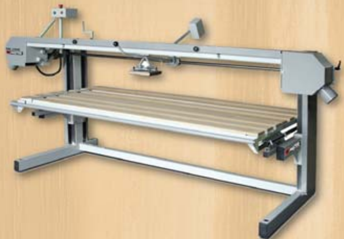
Abrasive belt grinding machine Bandschleifmaschine PBS 2400 Ленточный шлифовальный станок PBS 2400